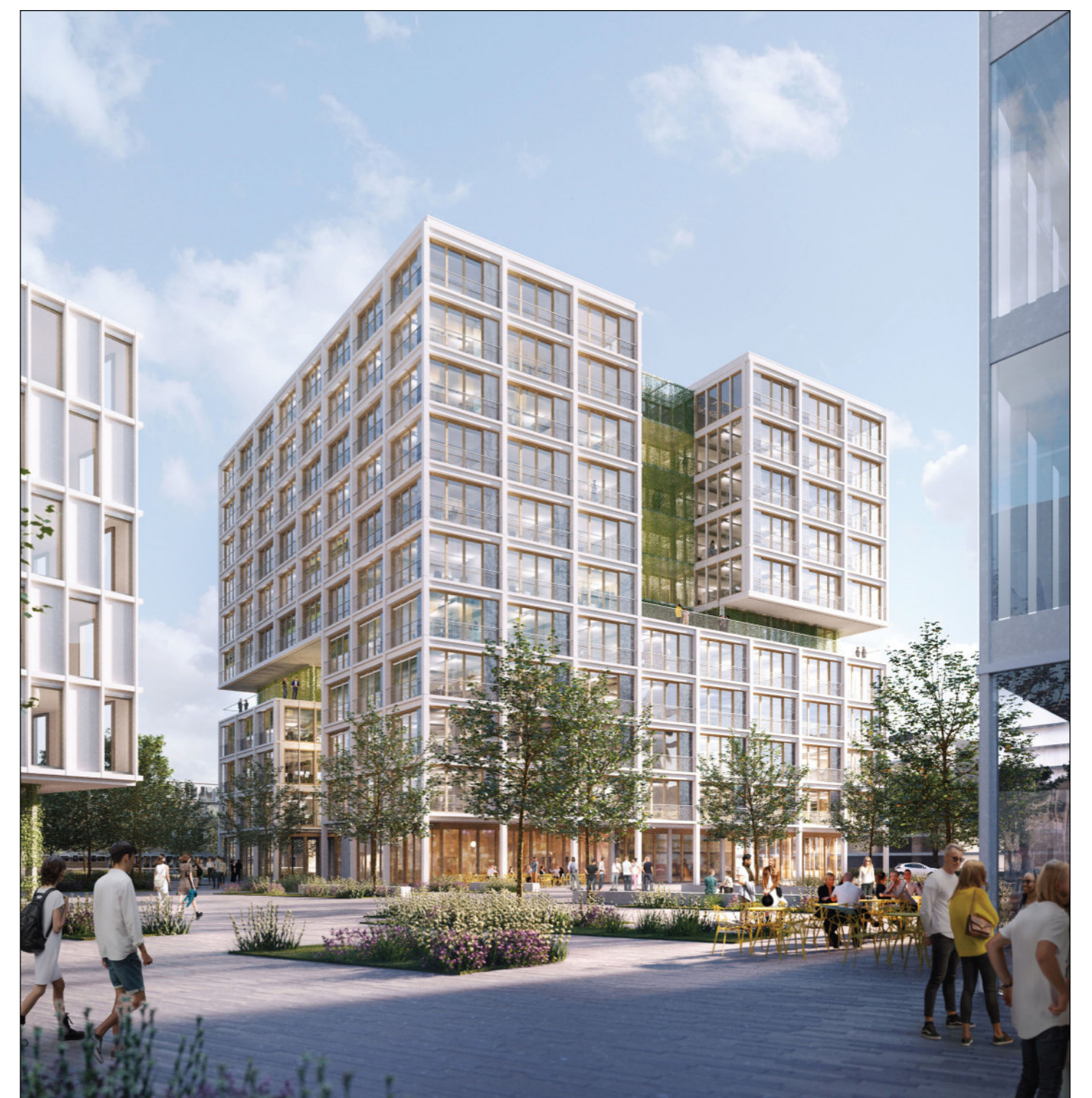
Visualisierung (ASTOC ARCHITECTS AND PLANERS GmbH)