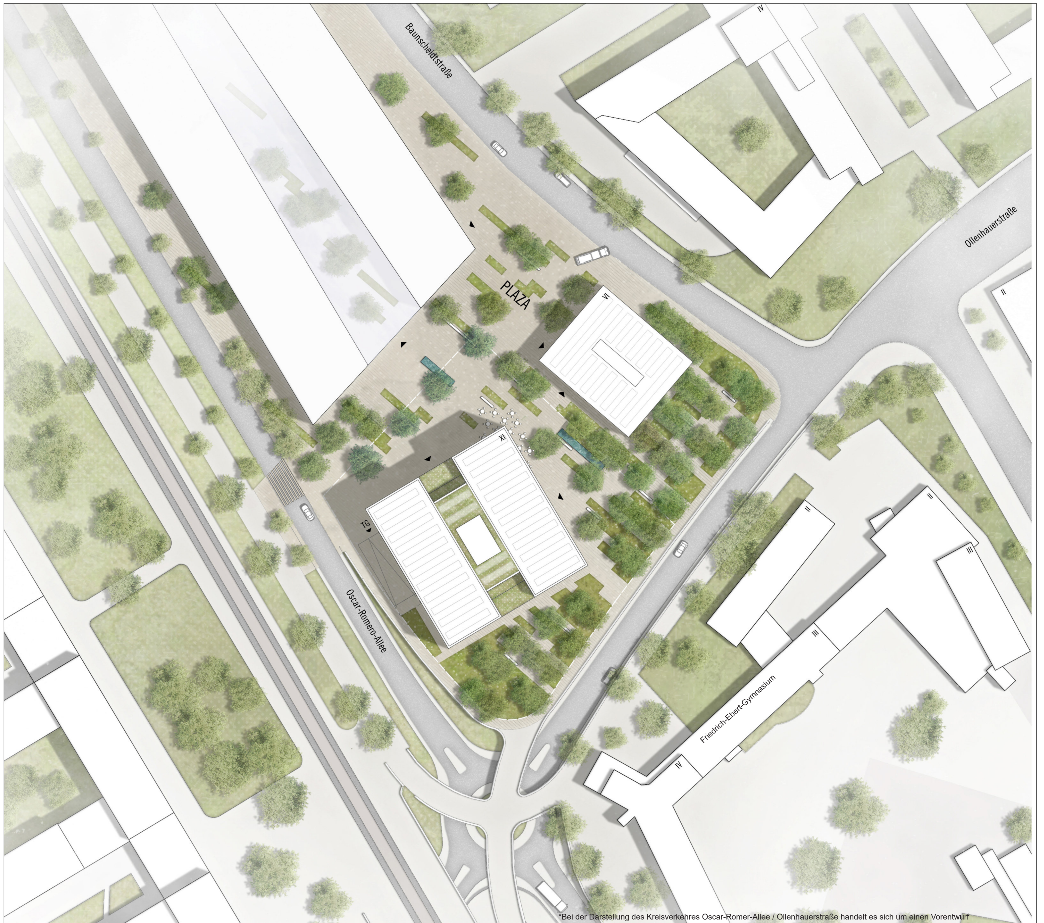
Lageplan i.M. 1:500 (ASTOC ARCHITECTS AND PLANERS GmbH)